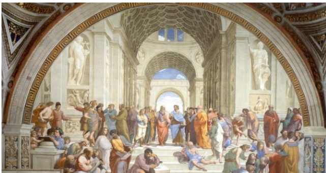
Sanzio Rafael. (1509-1511). La escuela de Atenas. Museo del Vaticano.

Observa la siguiente imagen y responde lo solicitado.